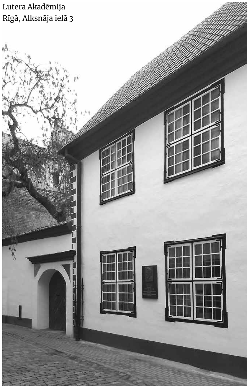
Lutera Akadēmija Rīgā, Alksnāja ielā 3