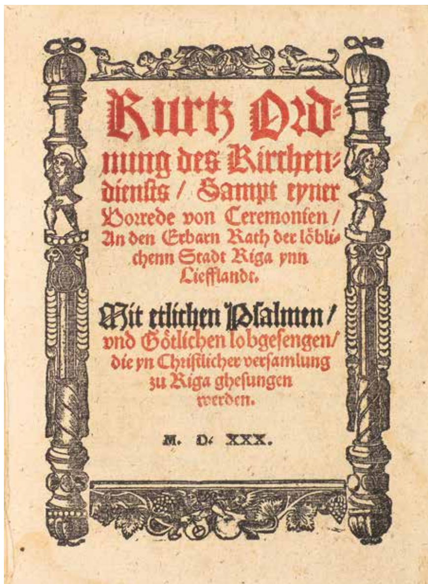
Titullapa un teksta pirmā lappuse Rīgas 1530. gada Baznīcas kārtības izdevumam